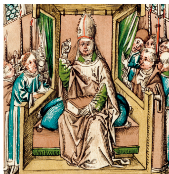
Papst Martin V.

1417 wurde mit Martin V. in Konstanz ein neuer Papst gewählt. Er steht für das „Jahr der Religionen“ 2017, in dem sich auch die Reformation zum 500. Mal jährt. Anlass, den interreligiösen Dialog innerhalb Europas zu suchen sowie den Austausch zwischen Christen, Juden, Muslimen und anderen Glaubensrichtungen zu intensivieren. Zur Luther-Dekade ergeben sich nicht zuletzt über Jan Hus Verbindungen. Zugleich laden die Konstanzer Bürger zu einem großen Fest ein und erinnern an die Rechte, die der Stadt