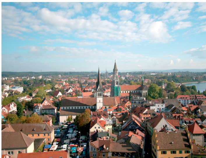
Blick über die mittelalterliche Altstadt

Gegenüber der Imperia steht das große, ab 1388 errichtete Kaufhaus . Hier wurde im November 1417 Martin V. zum neuen und einzigen Papst gewählt.