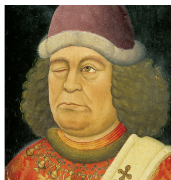
Oswald von Wolkenstein

2018 schließt das „Jahr der Kultur“ das Jubiläum ab. Gewidmet ist es Oswald von