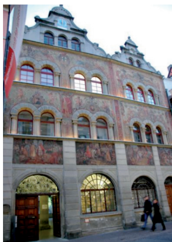
Rathaus in der Kanzleistraße

Das Konstanzer Konzil ist 600 Jahre später noch immer in der Stadt am Bodensee sichtbar. Bei einem aufmerksamen Spaziergang durch die Straßen und Gassen stößt man immer wieder auf Spuren und Darstellungen des großen Kongresses. Am Obermarkt ( Haus zum Hohen Hafen ), am Hohen Haus (Zollernstraße) oder am