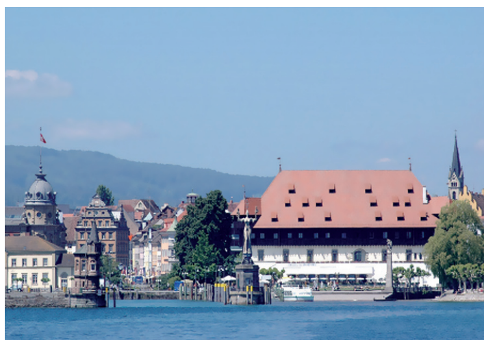
Ehemaliges Kaufhaus, heute Konzil

Unter dem Motto „Europa zu Gast“ knüpfen Konstanzer Bürger gemeinsam mit Gästen aus ganz Europa an die Ereignisse des Konstanzer Konzils an. Schon jetzt gibt es enge Verbindungen zu den Konstanzer Partnerstädten Fontainebleau (F),