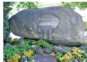
Hussenstein im Paradies

des Konstanzer Konzils ist die sogenannte „ Richental-Chronik “, die im traditionsreichen Rosgartenmuseum (Rosgartenstraße) betrachtet werden kann. Ulrich von Richental, Bürger der Stadt Konstanz, verfasste um 1420 eine Chronik der Konzilsereignisse, die später aufwändig illustriert wurde. Ihm verdanken wir einen anschaulichen Einblick in die